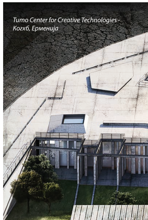
Tumo Center for Creative Technologies - Козхб, Ерменџа

■ Зависи од тоа како ја дефинирате логиката. Јас мислам дека сме многу прагматични во она што го работиме, наметнатите уверувања што претендираат да поставуваат норма, што е логично а што не е, се неуспешни кога ќе се најдат во одредени околности. Верувам дека еднаш кога ќе имате