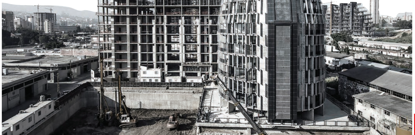
Plot # 4371 Бејрут, Либан

Значењето не е врзано со големината на објектот.