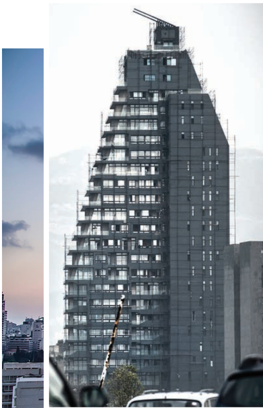
Plot 1072, Бејрут, Либан