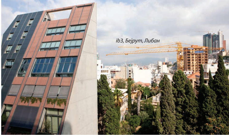
ib3, Бејрут, Либан

период на обнова. Затоа што не е во прашање само обнова на зградите туку обнова на целата нација низ постојењето на заедничката историја, консензус, реконструкција на институциите, нешто како постојење на заедничкиот идентитет и заедничкото сфаќање на проблемите што ги имаат жителите. Ништо од тоа не се случува, така што сметам дека војната не е завршена, бидејќи не можам ни војната да ја дефинирам на едноставен начин. На некој начин, многу повеќе е направена штета во текот на реконструкцијата отколку во самата војна. Последните неколку децении на обнова донесоа многу штета, можеби и повеќе отколку самото рушење во текот на војната.